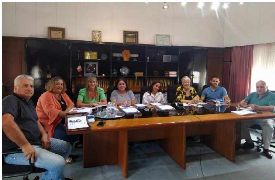
Concejales resolvieron que el municipio tome la problemática de la inseguridad

La nueva legislación establece la creación de las Guardias Locales de Prevención y Convivencia, como auxiliares de la Policía, delegadas a los municipios, incorporando prestadoras de seguridad privada, a la vez que les habilita el uso de las armas menos letales.