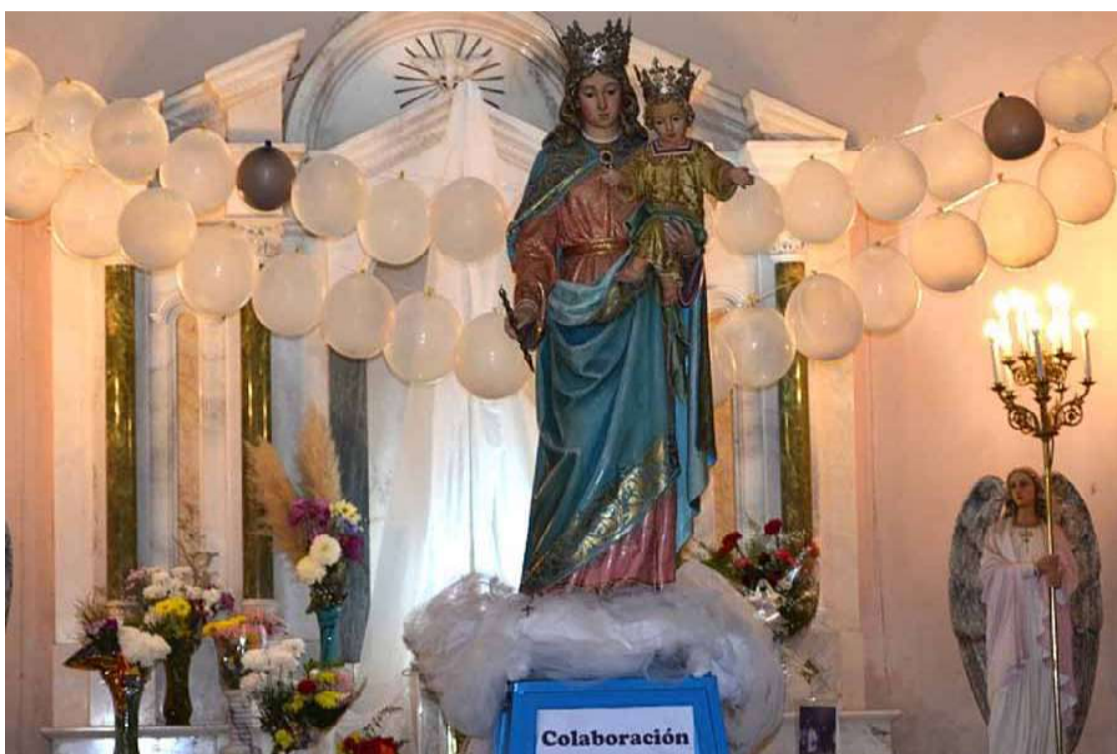
Santuario de María Auxiliadora

La peregrinación volverá a transformar a Colonia Vignaud en epicentro de la devoción mariana y del encuentro de las familias rurales, reafirmando el fuerte vínculo histórico entre María Auxiliadora con la participación de más de mil caballos y jinetes de agrupaciones gauchas de las provincias de Corrientes, Santiago del Estero, Santa Fe y Córdoba para ir en procesión hasta el monumento de la patrona del agro argentino en el parque Don Bosco.