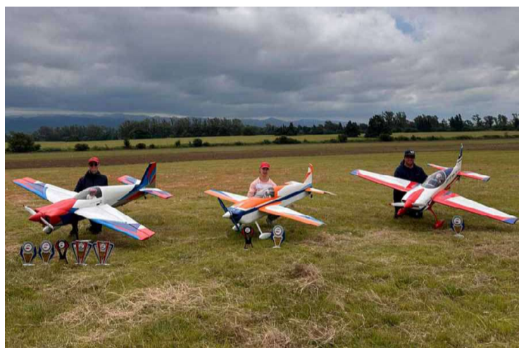
Aeromodelos que conquistan los cielos internacionales estarán en Suardi

El tradicional encuentro de aeromodelismo se lleva a cabo del 22 al 24 de mayo en su décimo cuarta edición