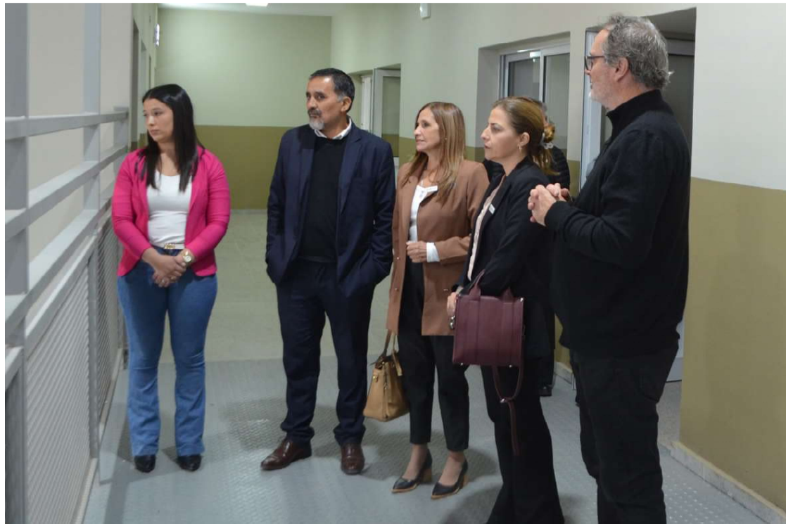
Las autoridades visitaron la sede de UPC Anexo Freyre que funciona en el edificio de Escuela con Formación Profesional "Clemar Cerutti"

«La existencia de la Universidad provincial permite frenar en parte el éxodo de jóvenes hacia las grandes ciudades y que no cuentan