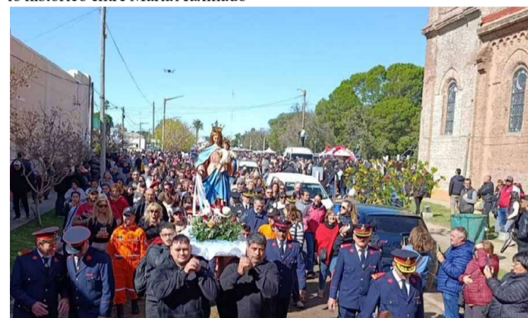
Tradicional procesión al monumento de la patrona del agro argentino