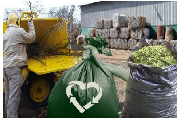
Buscan el mejoramiento ambiental

poda y césped deben dejarse sobre el espacio verde, o en