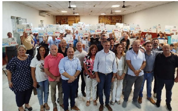
Autoridades provinciales y municipales, consorcios y productores en el acto

Con un componente cada vez más importante que tiene que ver con lo ambiental, están en la localidad del Ministerio de Ambiente y Economía Circular trabajando en relación