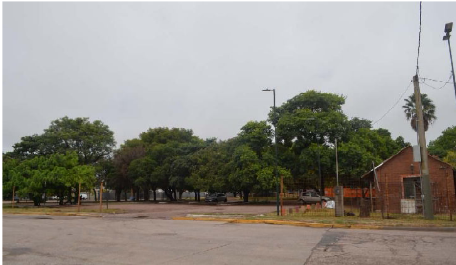
El municipio finalmente podría resolver no construir la sede de la Universidad en el predio del parque central, abría iniciado conversaciones para radicar la misma en el ingreso a la ciudad

Legisladores provinciales presentaron un pedido de informes al Ejecutivo Provincial acerca de los estudios de impacto ambiental presentados por la municipalidad de Morteros para la construcción del edificio para la sede de la universidad provincial