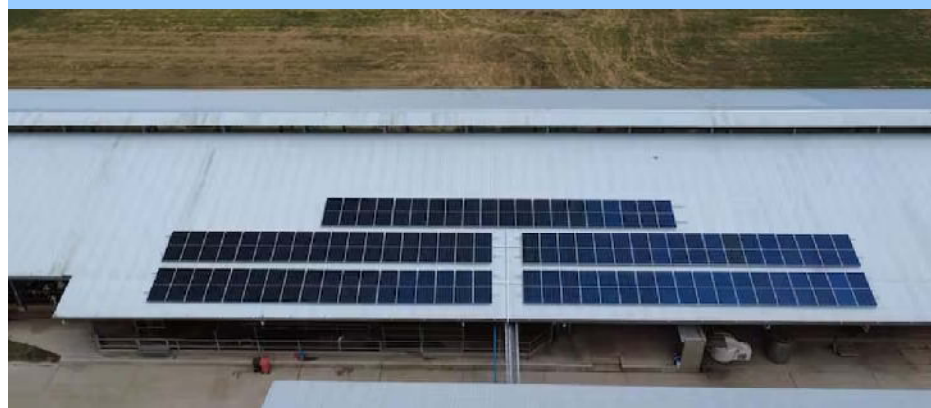
Paneles solares en el techo del galpón del tambo

La cooperativa láctea sumó 92 paneles para alimentar su tambo robotizado y avanza con un segundo módulo. La inversión total asciende a US$2,5 millones.