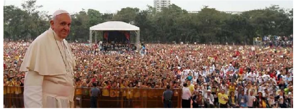
Millones de fieles despiden al Papa en Filipinas

de marzo, quizá en el momento más oscuro de la pandemia. "Densas tinieblas han cubierto nuestras plazas, calles y ciudades; se fueron adueñando de nuestras vidas llenando todo de un silencio que ensordece y un vacío desolador", describió el Papa.