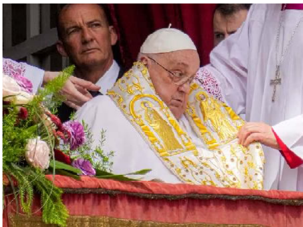
Así fue la última aparición del papa Francisco: la bendición pascual ante una multitud en la plaza San Pedro

una balance de su visión sobre la situación que se vivía en aquel momento. "Esta civilización mundial se pasó de rosca. Es tal el culto que ha hecho al dios dinero, que estamos presenciando una filosofía y una exclusión de los dos polos de la vida, que son las promesas de los pueblos: los ancianos y de los jóvenes", afirmó.