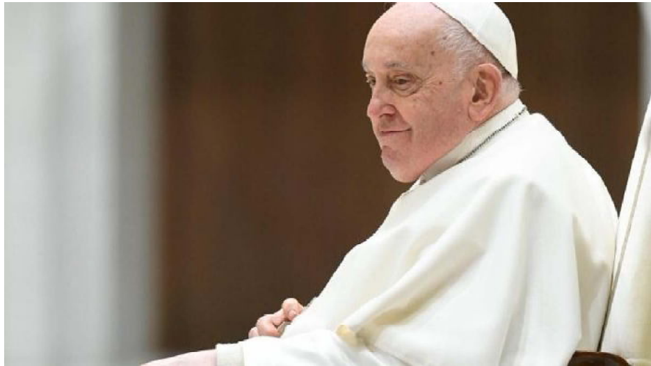
El domingo, el Papa Francisco participó de la misa de Pascuas en el Vaticano