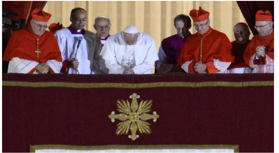
El 13 de marzo de 2013 cuando la fumata blanca se extendió por el cielo nocturno de la plaza San Pedro marcando el inicio de un hito

Jorge Bergoglio falleció en la madrugada del 21 de abril luego de reaparecer este domingo para participar de la misa de Pascuas en el Vaticano. La Iglesia confirmó que la muerte ocurrió a las 7.35 hora de Roma.