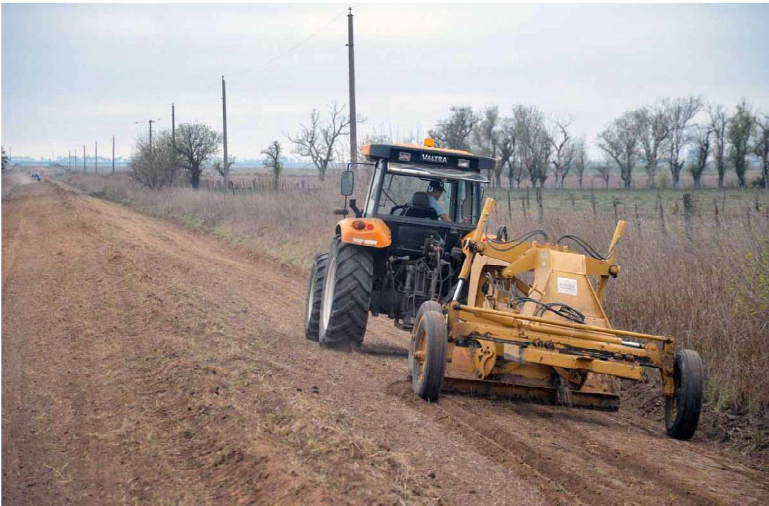
Un falló a favor del productor podría impactar en el resto de las comunas y municipios

Cobran por la tasa vial un impuesto por hectárea cuando deberían cobrar el servicio por kilómetro mantenido. Cobran litros de gasoil por hectárea, independientemente de la cantidad de kilómetros que haya de caminos.