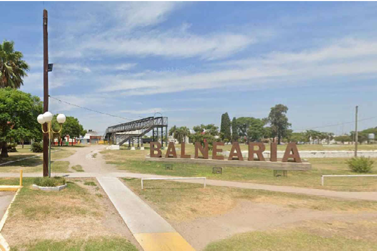
Espacio donde se habría producido el hecho de violencia urbana

Un enfrentamiento entre adolescentes fue protagonizado en el centro de Balnearia después de salir del local bailable Meet donde les proporcionaron alcohol. La policía identificó a quienes se enfrentaron pero no lo habría hecho con quienes violentan la legislación de comercialización de alcohol