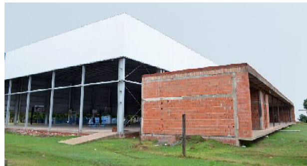
La conclusión de la obra del polideportivo en Club 9 de Julio es el proyecto más importante que están desarrollando

«Esto es algo que no se compra, se construye, la mutual logro la confianza y la solvencia, esos son los dos pilares para instituciones como estas funcionen, solo con confianza y sin solvencia no se puede hacer nada y viceversa solo con solvencia y sin confianza tampoco, esos dos factores son importantes y se construyen todos los días y se sigue alimentando, porque hay cuidarlo porque es fácil de perderlo y muy difícil de recuperar».