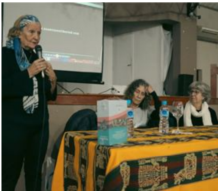
Autoras en la presentación

Las autoras destacan, además que «para llegar a nuestras casas -allí adonde la historia nos hizo anidar- ustedes podrán recorrer diferentes itinerarios, por nuestro país o el exterior. Serán guiados por estas mujeres que se nos parecen. Ellas caminan con jóvenes que podrán ser nuestras hijas y nietas. Con cada relato, les proponemos