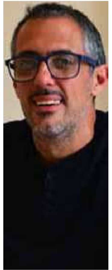
busca de trabajo, emprendedores y empresarios, nosotros pensamos en armar la ciudad, hoy tenemos todos los servicios»

«Cuando alguien decide a donde va a desarrollar su vida, siempre intenta buscar espacios donde encuentra todos los servicios y nosotros nos desafiamos a eso a que Morteros sea un lugar de elección para todos, para los que vienen en