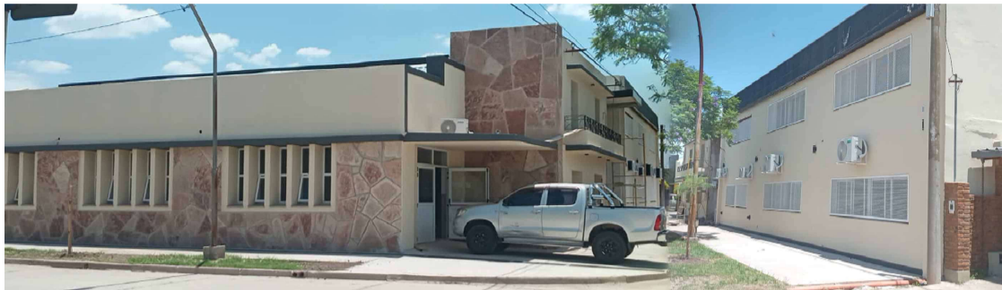
El edificio donde funcionará la escuela