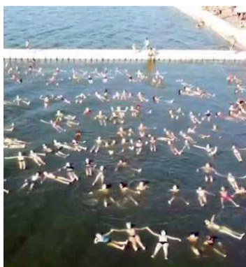
La convocatoria del año pasado

El propósito es superar las 1941 personas flotando en línea simultáneamente sin auxilio, pero no con-