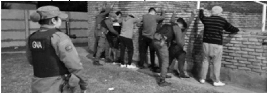
La presión a los pibes de los barrios para la foto, mientras la droga circula frente a sus narices

Solo es posible solucionar la problemática desde la política, dejando la cobardía, sin hipocresía para enfrentar la mafia. Quien tenga miedo debe decirlo, pero no seguir con el verso de la represión contra la niñez, adolescencia y juventud, porque es una receta que viene fracasando acá y fracasando en distintas ciudades de Latinoamérica. Todavía estamos a tiempo de construir una ciudad segura y no seguir apostando a la construcción de un infierno.