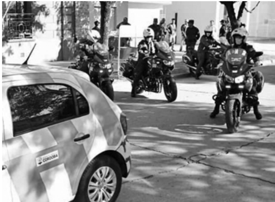
A cada llegada de Gendarmería el municipio monta una gran puesta en escena sin resultados

que llegó Gendarmería Nacional al departamento San Justo y cuatro años de la instalación de la delegación de Policía Federal y División Antidrogas.