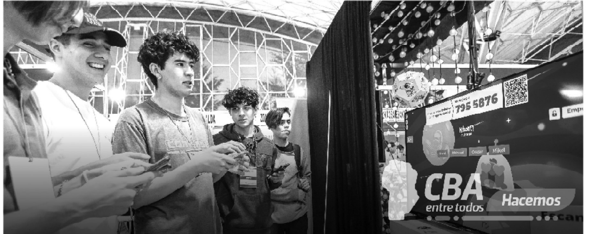
Distintas ciudades cordobesas serán sede de la Semana TIC.

En Río Cuarto, Villa María y San Francisco, se programaron diversas actividades que contarán con la participación de los ecosistemas tecnológicos locales.