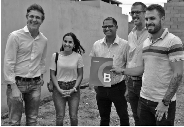
Entrega en Club Urquiza

«Fomentando el deporte, ayudando a los clubes hace