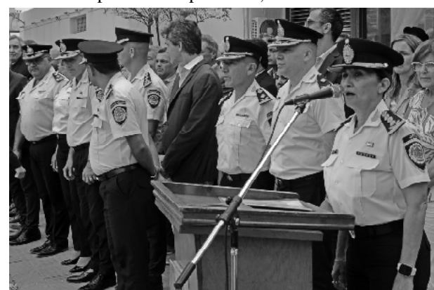
Crio Gral Liliana Zarate Belletti ofreciendo su mensaje

Más adelante anunció la creación de una división de Servicios Especiales en Ope-