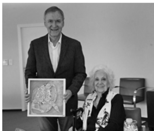
Schiaretti y Carlotto dialogaron sobre la importancia de continuar con el trabajo en materia de derechos humanos.

«Me voy muy feliz y agradecida», expresó Estela