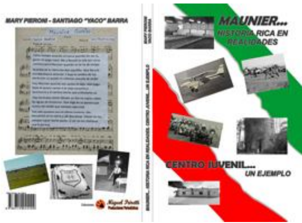
Contratapa y tapa del libro

«¿Quiénes somos?... ¿De dónde venimos?... ¿Qué su-