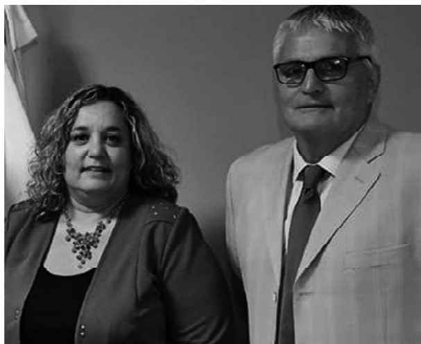
Gandino - Altieri