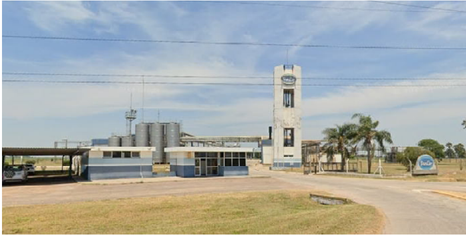
Trabajadores de la planta Balnearia estarían recibiendo telegramas

Sancor comenzó a despedir empleados en las plantas de Gálvez, Sunchales, La Carlota y Balnearia. Hablan de entre 200 y 500 empleados que estarían recibiendo telegramas. Acumula tres meses de demora en pagos de salarios y de la materia prima a los establecimientos lecheros remitentes.