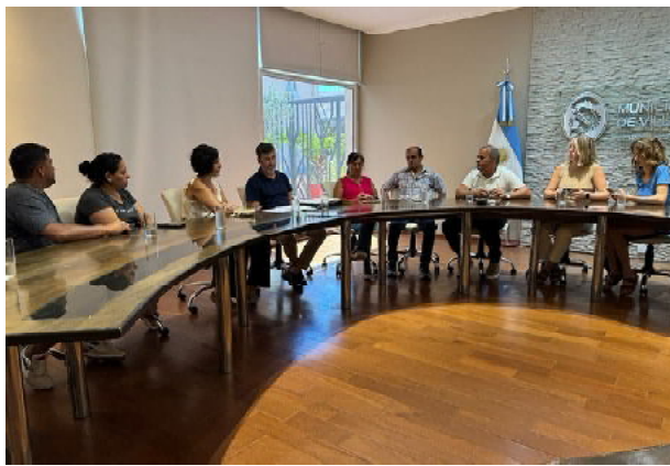
Reunión de adjudicación de los micro créditos