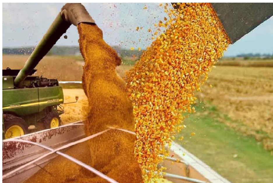
Los productores lecheros tendrán un aumento en costos. Los alimentos no deberían aumentar

La reducción de las retenciones a los granos tendrá un impacto de un bajo porcentaje en el costo de producción lechera, y cárnica, pero no tendría que generar aumento en los alimentos señalan especialistas