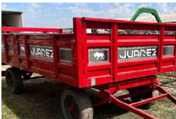
Foto ilustrativa de acoplado de similares características

acoplados y herramientas se vienen perpetrado en toda la región en los últimos meses, llamando la atención que en la jurisdicción de la Fiscalía de Instrucción de Morteros es en