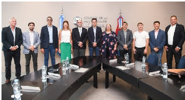
Los intendentes en el acto de firma de convenio

A partir de ahora, podrán utilizar los servicios y herramientas de la plataforma CiDi, para garantizar una respuesta ágil y eficaz a sus requerimientos. La adhesión de los municipios a los servicios de Ciudadano Digital se da en el marco de la Ley N° 10.618 de Simplificación y Modernización de la Administración.