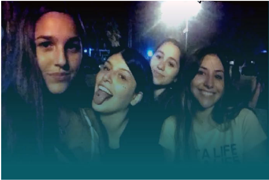
Las cuatro adolescentes que perdieron la vida