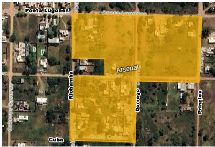
Las tres manzanas de barrio Arsenal georeferenciadas en el Renabap