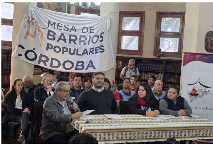
El encuentro en la iglesia y referentes de barrios populares

Las familias de Morteros que fueron incluidas en el Registro Nacional de Barrios Populares (Renabap) podrían quedar incluidas en la ley que impulsa el gobierno nacional. En una declaración pública, el cardenal Ángel Rossi advirtió que la ley de «Inviolabilidad de la propiedad privada» pone en riesgo la integración de 40 mil familias cordobesas entre las que podrían encontrarse familias morterenses