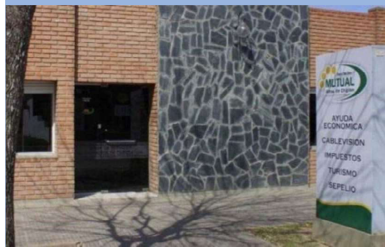
Operaba en la sede de la Cooperativa de Servicios Públicos