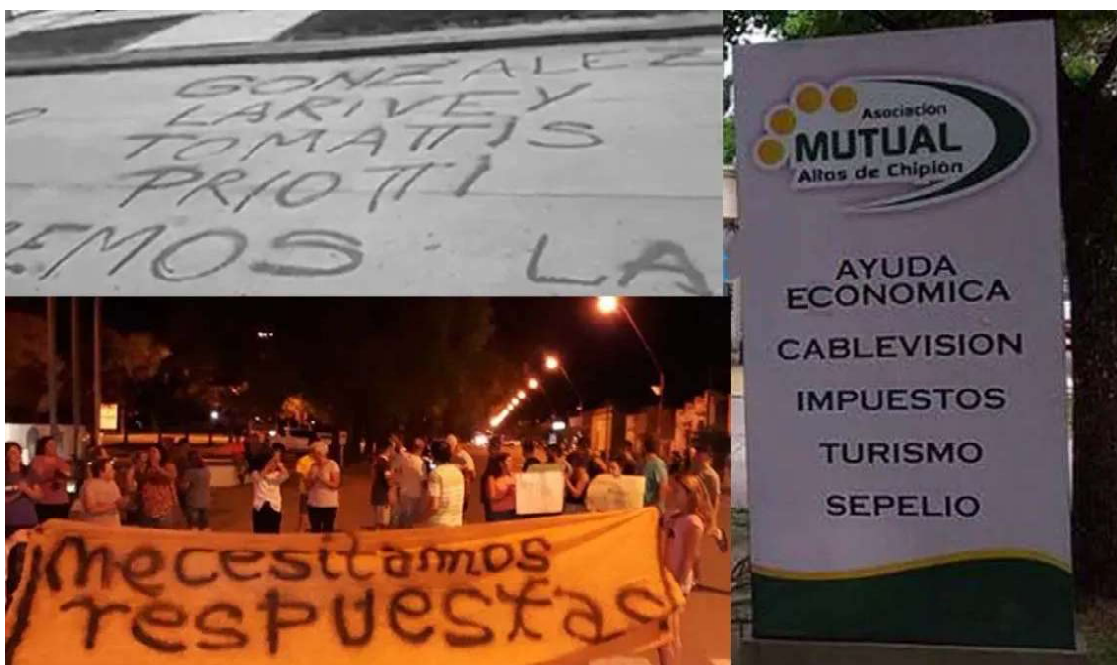
La comunidad estafada por la banda que operaba en la cueva se movilizaba en los primeros tiempos