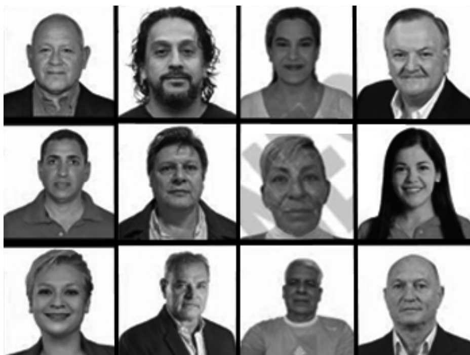
Candidatos a senadores por el departamento San Cristóbal

Las municipalidades de Suardi y San Guillermo de-