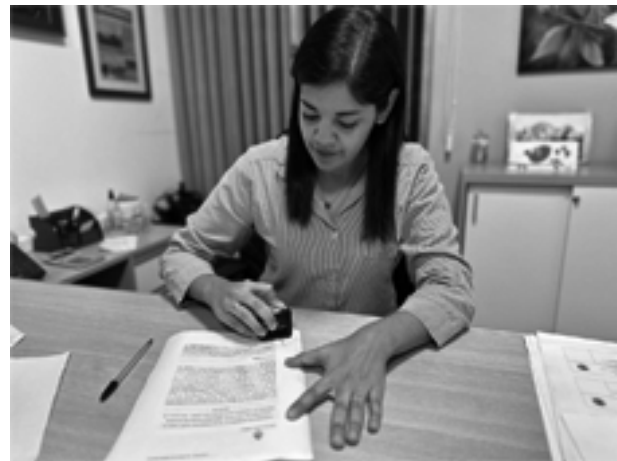
La intendenta firma el convenio para recibir $40 millones

da firma como una gran noticia para la comunidad», señalaron que «fue posible gracias a las gestiones del Municipio en Nación a través del programa «Argenti-