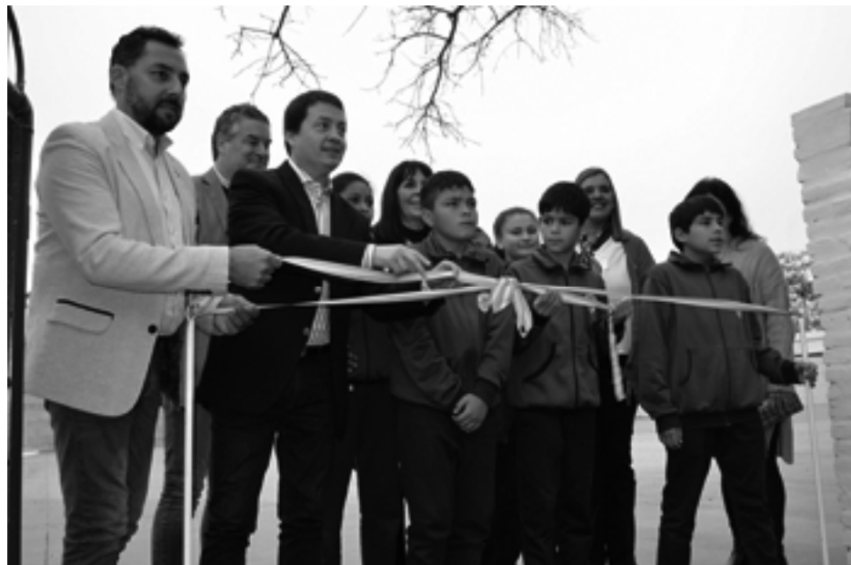
Autoridades, alumnas y alumnos cortan la cinta

La inauguración del playón polideportivo en el Centro Educativo 9 de Julio concretaron al realizar el acto conmemorativo del día de la Independencia con el protagonismo de las alumnas y alumnos.