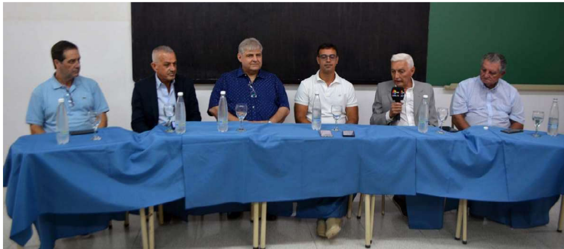
Directivos de la mutual, Femucor y Ceda en la conferencia de prensa

sitado a la institución educativo cuando era presidente del Inaes, en esta oportunidad lo hizo con el propósito de fortalecer los puentes que el Instituto Privado 9 de Julio tiene con la enseñanza del idioma chino mandarín respondiendo a distintas preguntas en una conferencia de prensa