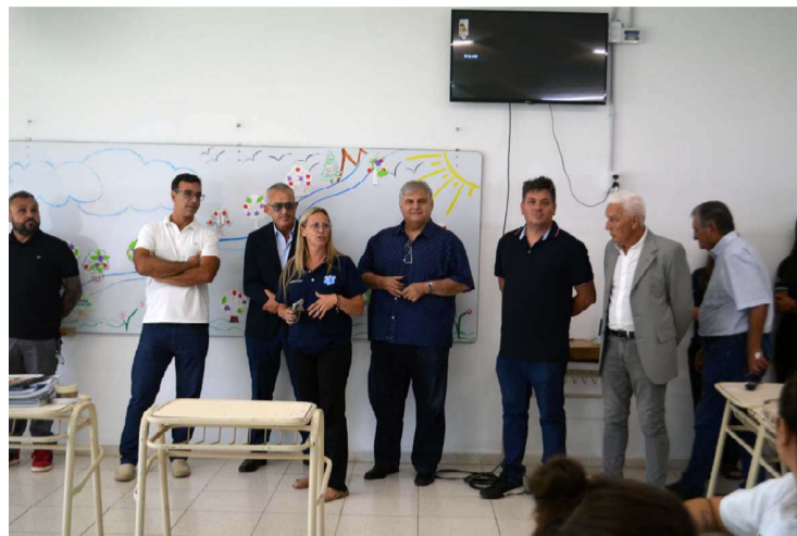
Toman contacto con docentes del Instituto

La Argentina para China es muy importante en términos históricos, en los peores momentos de la historia China, Argentina mandó alimentos. Son relaciones muy fuertes entre pueblos que no la quebran gobiernos perduran mucho más allá por eso estamos construyendo donde veremos sus efectos en 10 a 15 años, pero que hay idiosincrasias que se tocan, que significa conocerse, por eso tener jó-