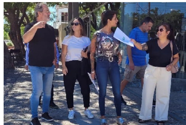
Funcionarios recorren el centro de Freyre

Freyre fue incluida en la edición 2024 del Programa Centros Comerciales a Cielo