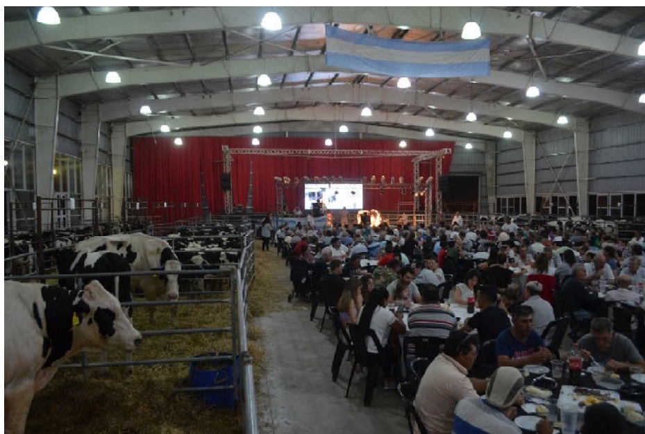
El salón de la lechería un centro comercializador de Holando Argentino

$ 20.000.000 logró una ternera de Cabaña La Lilia en un nuevo record. Masiva concurrencia de productores lecheros. Gran año para la lechería pronostico Salvador Di Stefano.