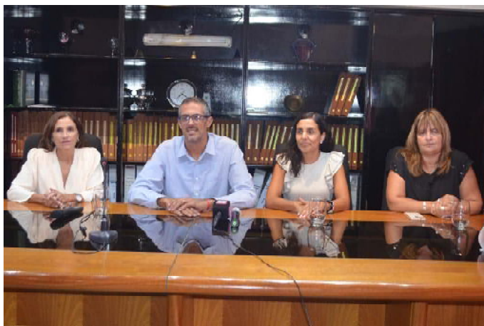
Autoridades en la conferencia de prensa

Al ser consultado acerca de la incidencia que tuvo el rechazo en