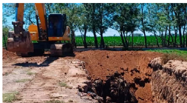
Cicatrización del basural

Para fortalecer la cultura ambiental existente en la localidad, promotores ambientales del Ministerio de Ambiente y Economía Circular de Córdoba realizaron visitas puerta a puerta, instalaron un stand y hablaron con estudiantes de distintos niveles