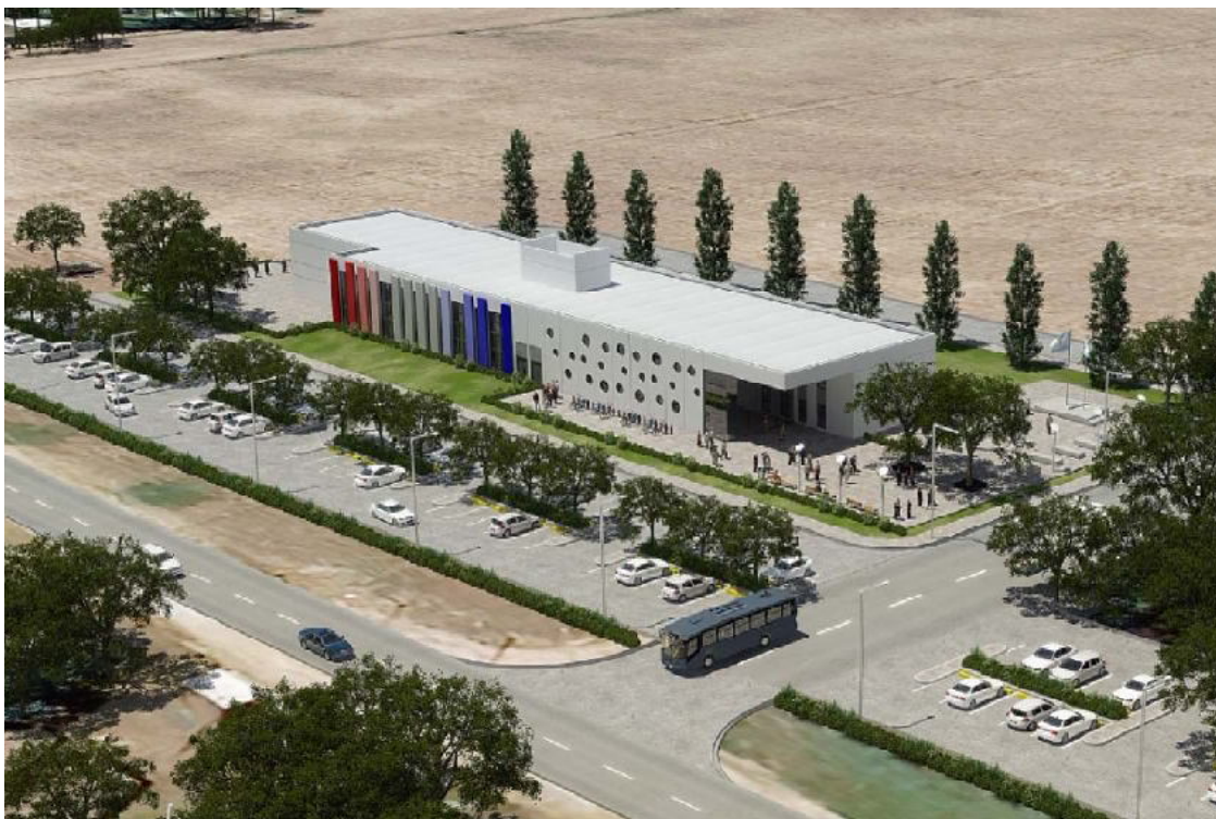
Render con la vista del edificio

Anunció que quienes llegan desde el sur será como lo es en la actualidad, mientras quienes llegan del norte tendrán transporte gratuito y sustentable como parte del desarrollo urbanístico, de la misma manera lo tendrán quienes vivan en la ciudad desde el Parque Central hasta la sede de la Univer-