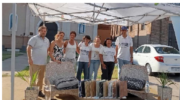
Autoridades y promotoras en stand con productos fabricados

En ese marco desde el Ministerio de Ambiente y Economía Circular, promotoras ambientales junto a integrantes del equipo de ambiente municipal que se desempeñan en la planta de reciclado local