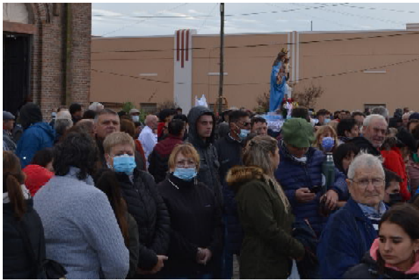
Inicio de la procesión

Como a cada año esperan a los fieles con mucho entusiasmo y expectativas, con una sincronizada organización al multiplicarse por 30 a 40 veces la cantidad de habitantes que tiene la comunidad con la intención de atender a los fieles de María Auxiliadora que llegan a este evento de religiosidad popular de la fe cristiana.