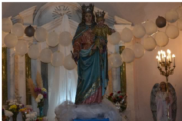
Santuario de María Auxiliadora y la Basílica Sagrado Corazón de Jesús

A las 20 se realiza la peña bienvenida a las agrupaciones gauchas en el salón Polideportivo Municipal con la actuación de grupos de danzas y conjuntos folclóricos de la zona donde habrá servicios de bufé tradicional