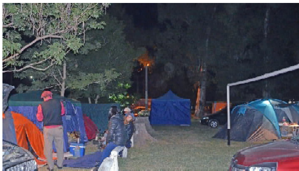
Peregrinos acampan en los parques