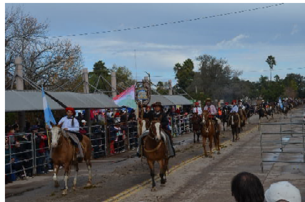
Desfile agrupaciones gauchas

El sistema de seguridad estará a cargo del destacamento local junto a la comisaría Brinkmann, Bomberos Voluntarios de Brinkmann colaboran en el ordenamiento del tránsito y en otros temas vinculados a la seguridad, donde se van a cerrar algunas calles para la circulación peatonal, mientras el estacionamiento contará con sectores cuidados por alumnos del IAS quien cobrarán un colaboración, mientras