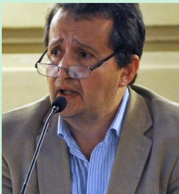
Diputado Carlos del Frade

Asimismo, se propone que los efectores de salud públicos, privados y los consultorios particulares de los profesionales de la salud, deben informar al registro los casos de patologías derivadas de la contaminación ambiental que detectan dentro de su ámbito laboral, en