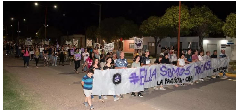
El reclamo por justicia de la comunidad no logró una condena satisfactoria para la familia

Ella primero luchó por su vida, ahora lo hace por recuperar su habla, su movilidad debiendo realizar cuatro veces por se mana un tratamiento de rehabilitación. Desde que ocurrió el hecho pasaron dos años y medio, sin haber podido lograr su recuperación total, pasaran algunos años más para intentar el mejoramiento de sus condiciones. El tiempo que deberá padecer la víctima es superior al que permanecerá privado de su libertad el violento hombre que habría planificado el ataque para apropiarse de ella.