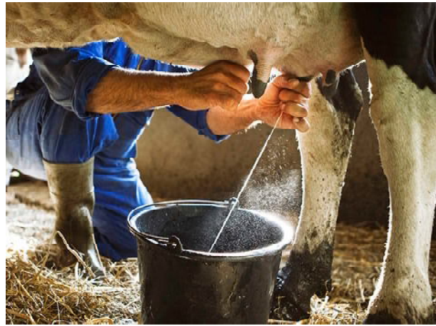
Antiguamente los productores argentinos tenían conciencia cooperativa en defensa de la producción

El estudio recordó que, en los principales países productores de lácteos, las cooperativas acaparan el 50% de la leche que se genera. Para el Ocla, esto evidencia «una gran atomización en el recibo/procesamiento de leche en Argentina, que se ha acrecentado después de los 90 y que en los últimos años se mantiene».