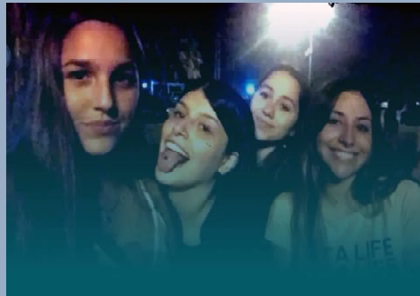
Las cuatro víctimas que perdieron la vida